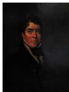
6. After Sir Henry Raeburn Portrait of Sir Brooke Boothby, bust length. 76 x 63,5cm