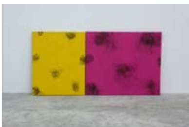
7. Sans Titre, Nöel Dolla 1992, 46cm x 53cm & 46cm x 38cm