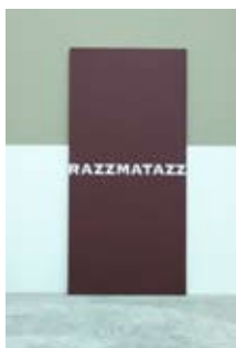
11. Razzmatazz, Christian Robert Tissot, 2002 210cm x 100cm