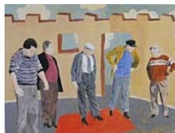
9. Sans Titre, Michel Castaignet, 2008 89cm x 130cm