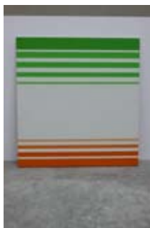
2. Sans Titre, Francis Baudevin, 1992 104cm x 110cm