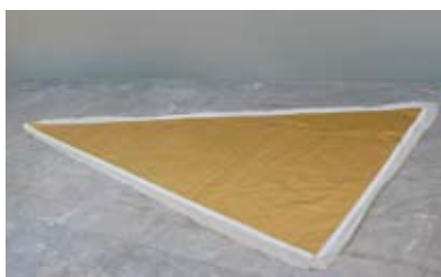
5. I will be here when you get here but I won't be waiting, Evi Vingerling, 2008 150cm x 300cm