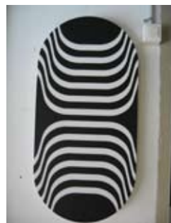
12. Bufo Marinus Philippe Decrauzat, 2008 81cm x 45cm