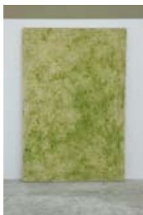
1. Le calorique propre, Jean-Sylvain Bieth, 1993 120cm x 80cm