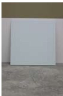
10. Untitled, Olivier Mosset, 1999 123cm x 123cm