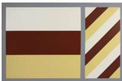
8. Color Proofs #2, Birgir Andr sson, 2006 90cm x 140cm