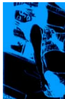
3. Sans Titre, John Cornu, 2001 116cm x 89cm